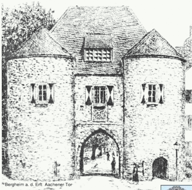
Bergheim a. d. Ertf Aachener Tor